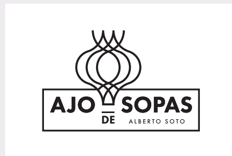
1 Tinta Black