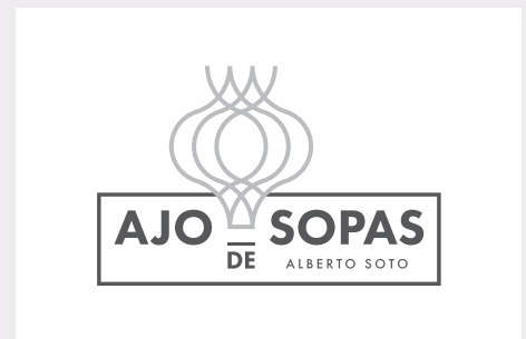
Escala de grises (80% black + 30% black)