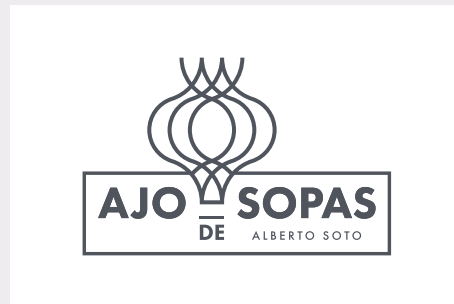
1 Tinta P 7547 U

En el siguiente apartado, se normalizan las distintas combinaciones cromáticas aceptadas, basadas en los colores corporativos descritos.