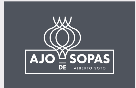
Negativo P 7547 U