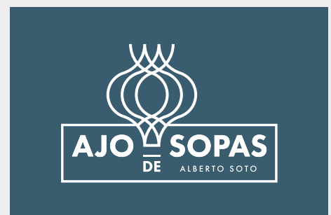
Negativo P 548 U