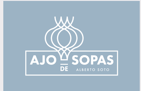
Negativo P 5435 U