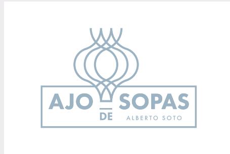
1 Tinta P 5435 U