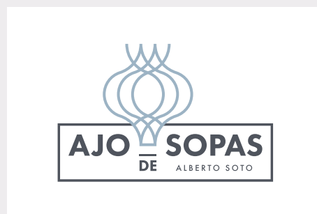
2 Tintas P 7547 U + P 5435 U